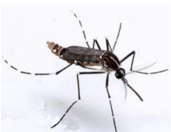
ഈഡിസ് ആൽബോപിക്റ്റസ് (ടെഗർ കൊതുകു്)

തിനാൽ ഡെങ്കിപ്പനിക്കും ചിക്കൂൻ ഗുനിയ പനിക്കും തമ്മിൽ ഏറെ സാമ്യമുണ്ട്. എന്നാൽ ഡെങ്കിയിലുണ്ടാകുന്ന രക്തസ്രാവം, രക്തസമ്മർദ്ദം കുറയൽ ഇവ ചിക്കൂൻ ഗുനിയ പനിയിൽ ഇല്ല. തലച്ചോറ്, വൃക്ക, ശ്വാസകോശം എന്നീ അവയവങ്ങളെ ചിക്കൂൻ ഗുനിയ പനി ബാധിക്കാറില്ല.