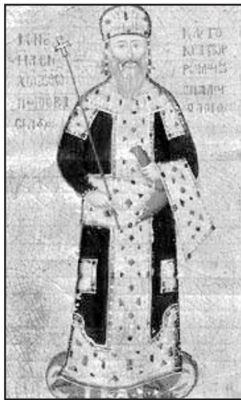
Manuel II Palaiologos (1391-1423)