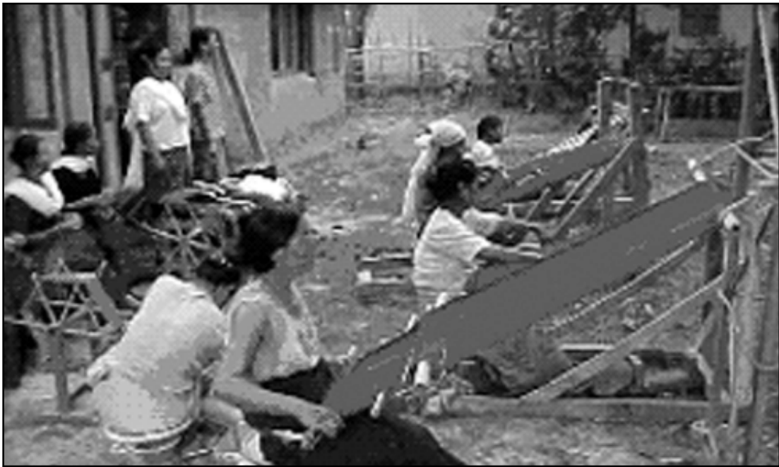
കൈത്തറിയിൽ വസ്ത്രം നെയ്യുന്ന ആവോ നാഗ സ്ത്രീകൾ

സർക്കാർ നോട്ടീസുകളും മറ്റുമാണ് പ്രധാന തപ്പാലുരുപ്പടി. എന്നേപ്പോലെയുള്ള ചുരുക്കം ചില വ്യക്തികൾക്ക് ചിലപ്പോഴൊക്കെ കത്തുകിട്ടാറുണ്ട്. കത്തയയ്ക്കേണ്ടിവരുമ്പോൾ ഞാൻ വൊക്കയിൽ പോയി പോസ്റ്റു ചെയ്യും. സാനീസിലെ പെട്ടിയിലിട്ടാൽ അത് നൂറ്റാണ്ടു കാലം അവിടെക്കിടക്കുമെന്നല്ലാതെ മറ്റു ഗുണമൊന്നും ഉണ്ടാകയില്ല. ഞായറാഴ്ച ഉച്ചകഴിഞ്ഞ് പോസ്റ്റോഫീസ് 'തുറക്കും'. പക്ഷെ, ആഴ്ചയിലൊരിക്കൽ കത്തുകിട്ടുമെന്നു ധരിക്കരുത്. എല്ലാ മാസവും ഒന്നാം തീയതി പോസ്റ്റാഫീസിലെ ശമ്പളം വാങ്ങാനായി വൊക്ക പോസ്റ്റോഫീസിൽ പോകും. മടങ്ങി വരുമ്പോൾ സാനീസിലേയ്ക്കുള്ള തപ്പാലുരുപ്പടികളും കൊണ്ടുവരും. അങ്ങനെ മാസ