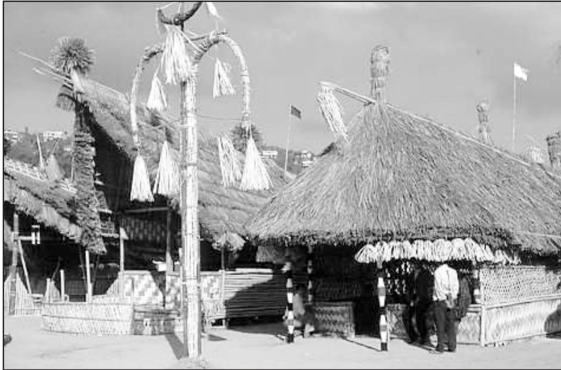
നാഗാ ഗ്രാമങ്ങളിലെ വീടുകൾ ഈ വിധത്തിലുള്ളവയാണ്

പുതുതായി ഒഴിവുവന്ന ജോലികൾക്കെല്ലാം മലയാളികളെ കണ്ടെത്തി. കുറച്ചധികം മലയാളികളെ നിയമിച്ചു. ഞാൻ അഡ്മിനിസ്ട്രേറ്ററായിരുന്ന കാലം മുതൽ തന്നെ മലയാളികളെ നിയമിക്കാറുണ്ടായിരുന്നു. തികച്ചും മാനുഷിക പരിഗണനയായിരുന്നു ഇതിന്റെ പിന്നിലുണ്ടായിരുന്നത്. ഞാൻ ജോലി തേടി നാഗാലാൻ്റിലെത്തിയ കാലം എന്റെ കൺമുമ്പിൽ നിന്നും മറഞ്ഞിരുന്നില്ല. അന്ന് എന്നോട് കരുണ കാണിക്കാൻ ചില മലയാളികളുണ്ടായിരുന്നു.