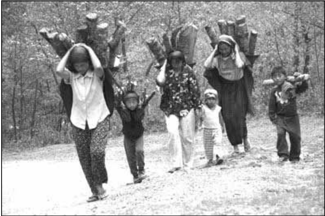
നാഗസത്രീകളും കുട്ടികളും വിറകുമായി വീട്ടിലേക്ക്

“ചോ തക” (ഉണ്ടു) എന്നു മറുപടി. അഥവാ ഉണ്ടില്ല എങ്കിൽ “ൻ സോഹാ” എന്നു പറയാം. പക്ഷെ ചോറുണ്ടു എങ്കിൽ വീണ്ടും പല ചോദ്യങ്ങളുണ്ടാകും. “ൻ തോ ഹാലാ?”