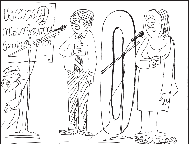
ആറ്റാൻ അമൃതകോടതിനും മേട്ടപ്പം തൊണ്ണൂറ്റൊമ്പതൊണ്ണും. മടന്നു കറുത്തു; മിന്നു ആറ്റാൻ മേട്ടപ്പം